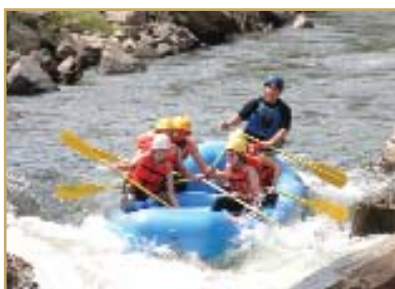
Българският отбор на стажа

- South-Western Company е издателска компания, която работи с учебници и софтуер, предназначени за подпомагането на учениците в подготовката на техните домашни работи, както и даващи възможности на родителите да следят как децата им се справят в обучението. Студентите-стажанти имат възможността да управляват свой малък бизнес в продажбите. Те ежедневно правят по 30 презентации на продуктите пред американски семейства.